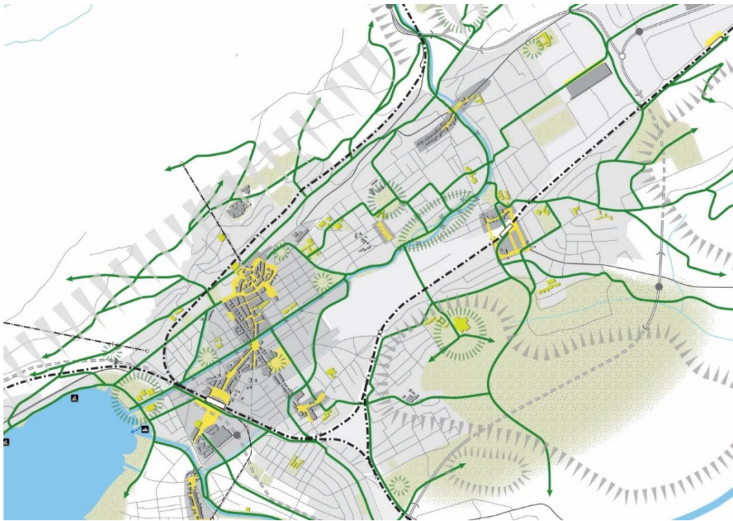
Stratégie globale de mobilité, réseau de promenades structurantes paysagères : les quais de la Suze sont identifiés sur l'ensemble du tracé du cours d'eau comme promenade paysagère (illustration mrs partner ag)